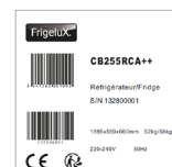
Exemple d'étiquette du carton

Vous recevrez au plus tard le 15/05/2022 et après réception de votre dossier conforme, votre remboursement. Pour toute question à propos de l'offre vous pouvez nous contacter à hello@frigelux.fr .